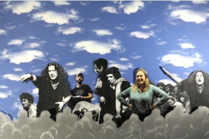
Iz animacije "LegiLAB - Eksperimenti v zakonodajnem gledališču", avtorici Lucija Smodiš in Brina Fekonia

Občinstvu se najprej predstavi forumska gledališka igra. Še pred tem pa džoker_ka 8 – tako se v gledališču zatiranih imenuje moderator_ka in facilitator_ka, ki skrbi za komunikacijo z občinstvom – gledalke_ce povpraša: »Če bi lahko uzakonile_i kak nov zakon, kakšen zakon bi hotele_i?«