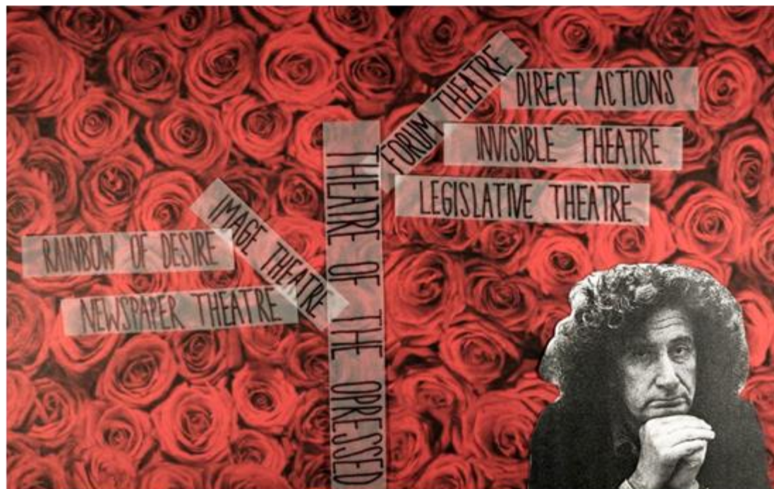
Iz animacije "LegiLAB - Eksperimenti v zakonodajnem gledališču", avtorici Lucija Smodiš in Brina Fekonja

Zakonodajno gledališče 1 je razvil brazilski gledališki režiser Augusto Boal. 2 Gre za eno od »vej« gledališča zatiranih, 3 ki je skupno ime za vse tehnike tovrstnega gledališča, ki so se razvile v teku 40 let. Pod vplivom radikalnega pedagoga Paula Freireja 4 je Boal gledališče zatiranih razvil z namenom, da bi gledališče uporabljal kot kooperativen, vzgojen in političen proces. Gledališče zatiranih, v nasprotju s tradicionalnim gledališčem, publiki omogoča, da se udeleži gledališkega dogajanja in uporabi gledališče kot vajo za resničnost.