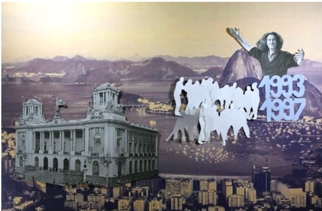
Iz animacije "LegiLAB - Eksperimenti v zakonodajnem gledališču", avtorici Lucija Smodiš in Brina Fekonja

Zakonodajno gledališče predstavlja nadgradnjo tehnike forumskega gledališča, 5 pri katerem lahko občinstvo ustavlja igro, prihaja na oder in spreminja smer, v katero se razvija predstava, prek tega pa se poučijo o določenih oblikah zatiranja in kako jih premagati.